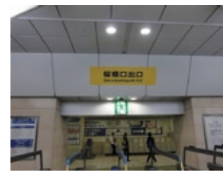
JR大阪駅桜橋口出口からスタート