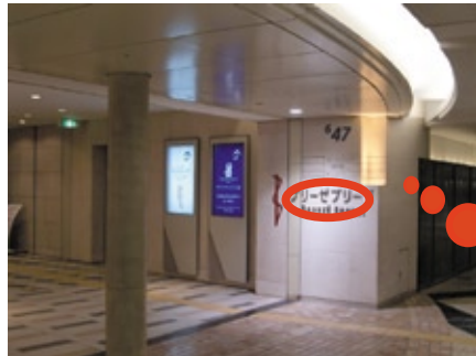
壁に『ブリーゼブリーゼ』と、 書かれている所がハービス OSAKA の ある場所です。右がハービス OSAKA です