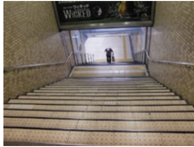
改札正面の階段を下ります