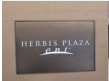
ここは『ハービス ENT』です