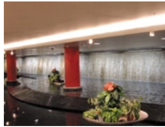
この辺りに水の流れるスペースがあります